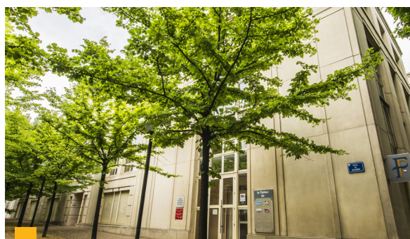
26, allée de Mycène à Montpellier (34)